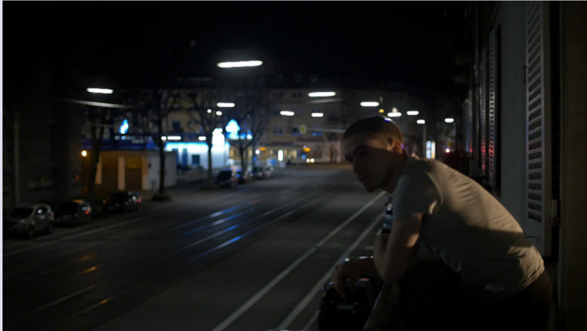
I'll be fine (9 min), 2016, Fiction